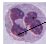
leucocyte polynucléaire = phagocyte